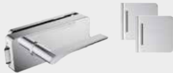
Edelstahl-Optik poliert, Design: sieger design