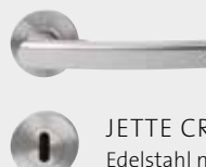
JETTE CRYSTAL Edelstahl matt/poliert Design: Jette Joop