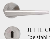
JETTE CUT Edelstahl matt Design: Jette Joop