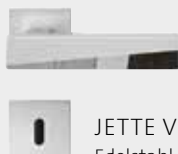
JETTE VISION RG Edelstahl matt/poliert Design: Jette Joop