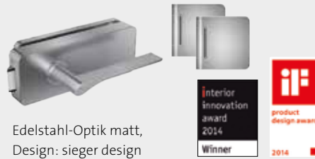
Edelstahl-Optik matt, Design: sieger design