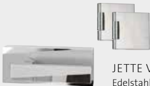
JETTE VISION SKS Edelstahl matt/poliert Design: Jette Joop